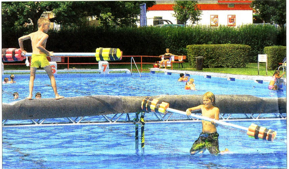
Beim Lanzenstechen gilt es, den Gegner ins Wasser zu befördern.

Bei Geschicklichkeitsspielen wie Surfbrett- oder Schlauchbootrennen, Lanzenstechen und Ball-Zielspritzen gab es kleine Preise zu gewinnen, und im Anschluss an die Vorführung des Tauchclubs »TaWo Diving« hatten Kinder die Gelegenheit, beim »Schnuppertauchen« einmal selbst mit Taucherbrille und Schwimmflossen ausgerüstet in das 1,7 Millionen Liter Wasser