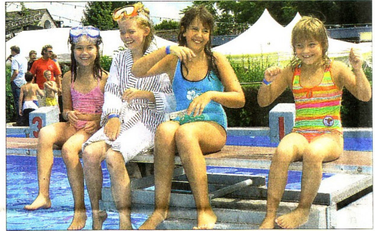
Kleine (rechts) und größere Wassernixen (links) haben beim Schwimmbadfest reichlich Spaß.